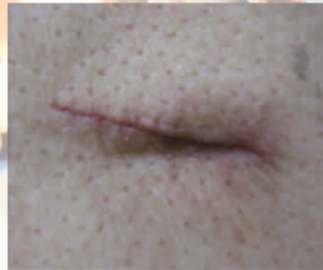
Sütür kullanılan hasta 30. gün

Ekimed Medikal Sağlık Ürünleri Tekstil Gıda Paz. San. Tic. Ltd. Şti.