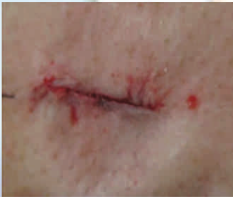
Sütür kullanılan hasta İlk gün