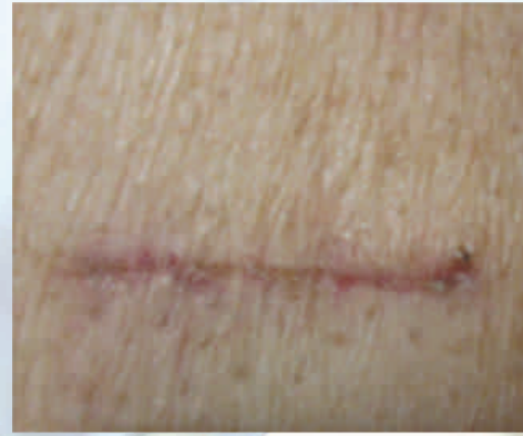
Tissue Aid kullanılan hasta 30. gün